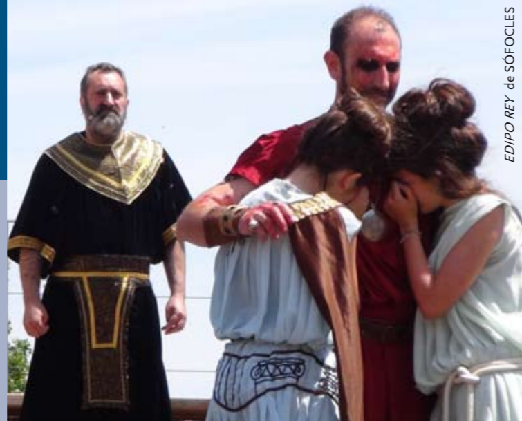
EDIPO REY de SÓFOCLES