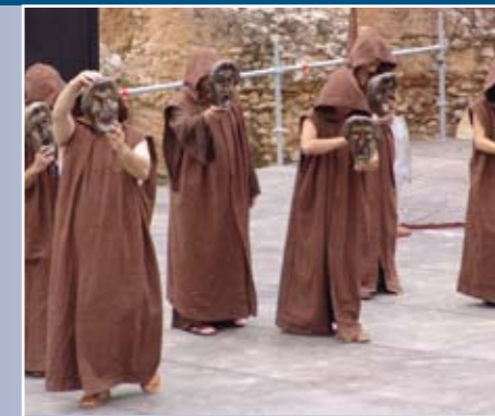
"El Grupo Balbo representando Antígona en 2008 en Clunia"

El grupo "El Aedo" de El Puerto de Santa María (Cádiz) representará a las 12:30 ANTÍGONA de SÓFOCLES