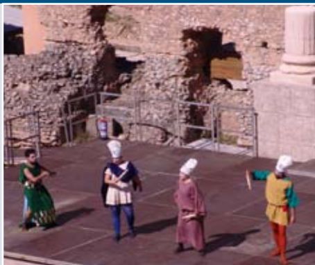
"El grupo El Aedo representando Pseudolus en 2012 en Clunia"

El grupo "El Aedo" de El Puerto de Santa María (Cádiz) representará a las 17:00 MILES GLoriosus de PLAUTO