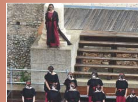
"El Grupo Komos representando Medea en 2017 en Clunia"

Años más tarde Tebas es asolada por la peste, Edipo envía a su cuñado Creonte a Delfos para consultar el oráculo y este vuelve con esta respuesta de Apolo: "la peste solo desaparecerá cuando se halle al asesino de Layo y se le castigue".