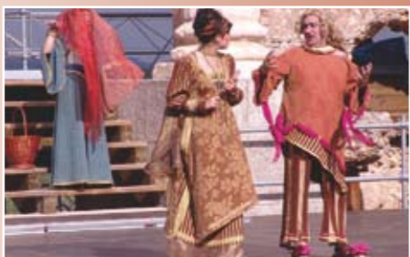
"El Grupo SV Producciones representando Cistellaria en 2014 en Clunia"

La discusión sobre cuál es el mejor partido matrimonial para Cásina se resuelve con la aceptación de un sorteo. Vence Olimpión. Entonces Cleústrata disfraz a Calino de novia y burla a su marido y a Olimpión.