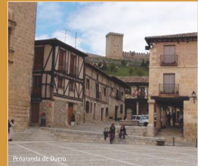
Peñaranda de Duero